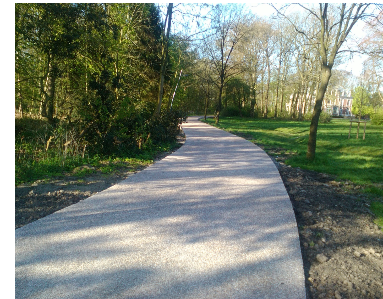
Revêtement de la voirie d'accès en béton 'parcmix' @