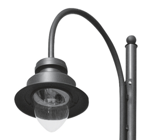
Luminaire pour voirie principale