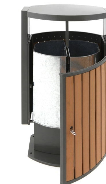
Poubelles pour le tri sélectif